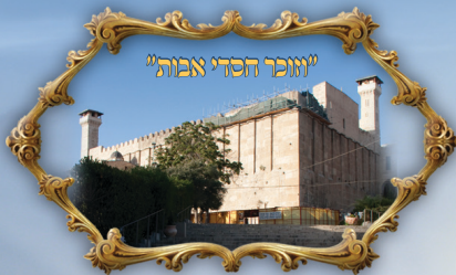
"יוזכר חסדי אבות"