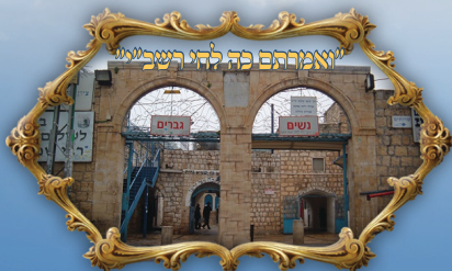
"ואמרתם פה להי רשכ"