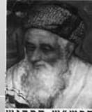
הר"ש ש הקדוש הרש"ש והזוהר רצ"ד דף מ"ב 4