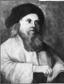
הבעש"ט והזוהר רצ"ד דף מ"ב 6