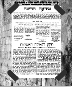
רצ"ד דף מ"ב 2