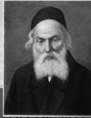
החפץ חיים והזוהר רצ"ד דף מ"ב 8