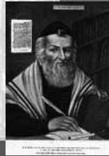
הגרי"ם והזוהר רצ"ד דף מ"ב 8