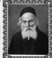
רבנו ישראל מאיר הכהן בעל התעמ חיים

"לשון הקדוש יותר מכל מאמרי החז"ל" (מעשי איש, ממרן הגאון הקדוש בעל החזו"א זצ"ל)