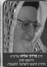
הרב מרדכי אלוהי שליט"א הראשון לציון הרה"ג הראשון לישראל (לשעבר)