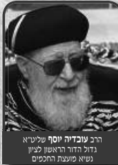
הרב עובדיה יוסף שליט"א גדול הדור הראשון לציון נשיא מועצת החכמים